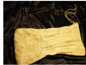
Saquet de roba on es custodiaven les monedes del Comú de Canillo que es conservaven a casa Bonavida. Comú de Canillo/Col·lecció de casa Bonavida.

En una recuperació de documents del Comú de Canillo que es trobaven en la caixa arxiu de casa Bonavida, duta a terme l'any 2009, es va trobar un saquet de roba que contenia 41 monedes datades entre el segle XVII i el 1962. A continuació es mostra un quadre on es detallen les monedes, la seva datació i la seca on foren encunyades.