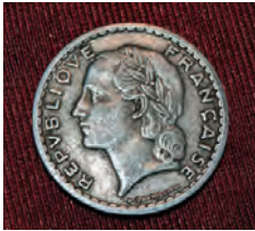
5 cèntims de franc de l'any 1962. Comú de Canillo / Col·lecció de casa Bonavida.

continuaren fent la conversió dels valors a francs antics. El franc se subdividia en monedes de 10, 20 i de 50 o ½ franc, i com a unitat van circular les monedes d'1, 2, 5, 10 i 20 francs. En la seva darrera etapa els francs eren compostos d'un aliatge de bronze, alumini i níquel, i els darrers foren encunyats en acer inoxidable. La Fàbrica Francesa de la Moneda fou l'encarregada d'encunyar els francs a les acaballes de la Segona Guerra Mundial.